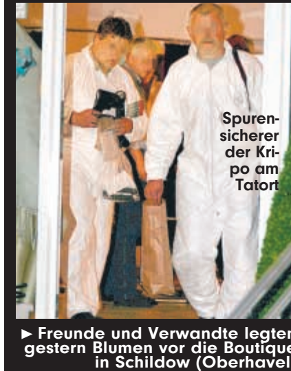
Spurensicherer der Kripo am Tatort